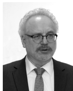
Egils Levits, Dr. h. c. iur.

Eiropas Savienības Tiesas tiesnesis, Latvija